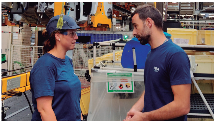
Delegado atendiendo a una trabajadora en el Taller de Montaje.

Siempre tendréis un interlocutor cerca que os atenderá y responderá a la mayor brevedad. Nuestros delegados están continuamente a pie de línea, en cercanía con los afiliados, para asegurar una atención eficaz.