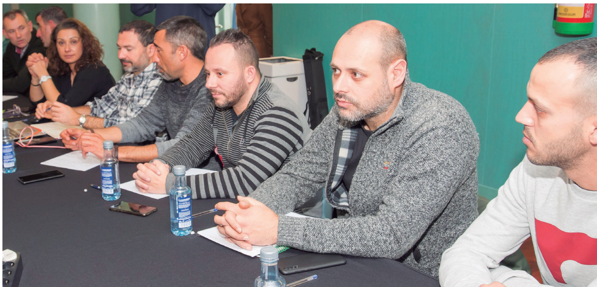
Reunión Convenio Colectivo 2020.