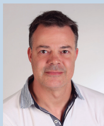
Francisco Alberto de Miguel Ingeniería Montaje