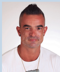
Jorge Carrera Fernández Pintura