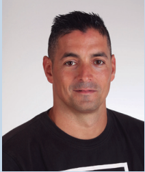
Alberto Vázquez Estévez Pintura