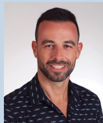
Juan Posada Martínez Pintura