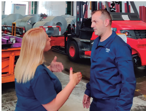
Delegada atendiendo las demandas de un trabajador en el Taller de Embutición.

como en la “APP SIT-FSI afiliados” . Somos un Sindicato sencillo, directo, centrado en nuestra empresa, sin interferencias ni injerencias exteriores, ni intereses políticos, donde las personas que lo gestionamos conocemos los talleres y las diferentes particularidades de cada uno, lo que nos confiere un plus de eficacia y resolutiveidad en los conflictos que se pudiesen plantear.