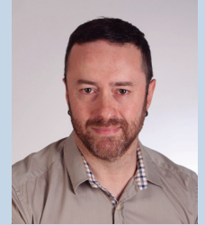
Jorge García Presa Pintura